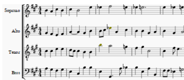
圖2. 方法 B 所生成的樂段範例

使用方法 A 生成的樂段雖然品質較好，但缺乏獨特性，有些段落與輸入音樂極為相似，為了改善此問題，我們將目標資料做時間位移。