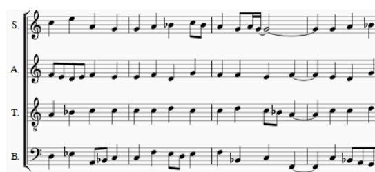
圖1 方法 A 所生成的樂段範例

使用方法 A 生成的樂段雖然品質較好，但缺乏獨特性，有些段落與輸入音樂極為相似，為了改善此問題，我們將目標資料做時間位移。